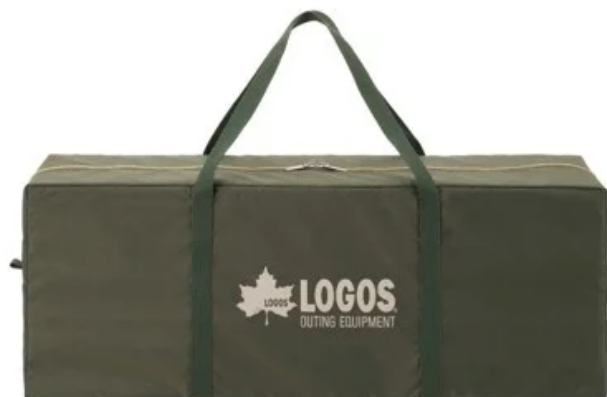
「SUPPORT BELT SYSTEM」

余分な力を使わず簡単に扱える「SUPPORT BELT SYSTEM」採用で、フレームをセット後に伸ばしたベルトを短く締めるだけで、設営が可能に。撤収時もベルトを緩めることで、フレームをリングピンから簡単に外すことができ、お手軽にファミリーキャンプを楽しめる。収納バッグも付属しているので、持ち運びしやすい。