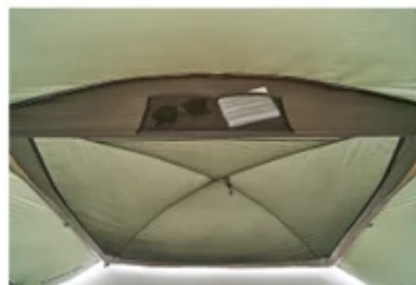
(左上)エアコン用ダクト差し込み口 (中央)バックドア (右上)回転式ジッパー (左下)電気コードジップ (右下)フライメッシュポケット