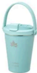
ThermoWall 真空断熱 タンブラー360