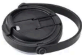
ThermoWall セーフシップタンブラー交換用ふた