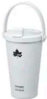
ThermoWall 真空断熱 タンブラー480

交換用キャップとして、クイックオープン構造で飲みやすい「ThermoWall セーフシップタンブラー交換用ふた」と、密閉仕様で持ち運びに便利な「ThermoWall キャリータンブラー交換用キャップ」の2種類を展開。お好みに合わせて付け替えも可能。