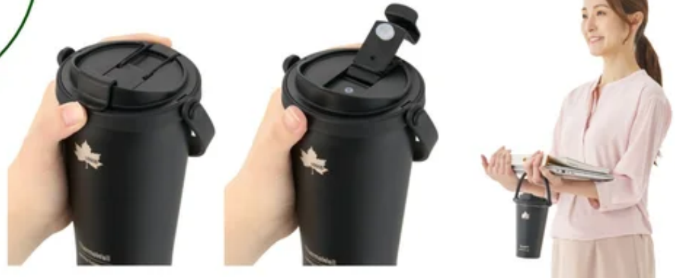
※ 「ThermoWall 真空断熱 タンブラー」

「ThermoWall 真空断熱 タンブラー」は、車の運転中やデスクワーク時にも片手で飲みやすいクイックオープン構造のキャップを採用。持ち運びに便利なハンドル付きで、折りたたみ可能なためバッグ収納時にもすっきり収まる。