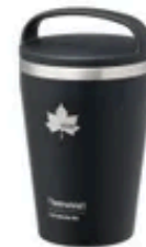
ThermoWall 真空断熱 キャリータンブラー350