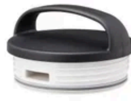
ThermoWall キャリータンブラー交換用キャップ