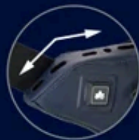
3D形状の風穴で 前方にも風を届けます。