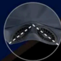
V型のFANレイアウトで 体全体に立体送風。

パワーアップの最大の秘訣は「Vツイン気流」。 背中から上半身全体をVの字に 包み込むように風を送ります。