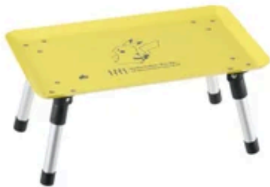
【ポケモン スタックカラーテーブル】