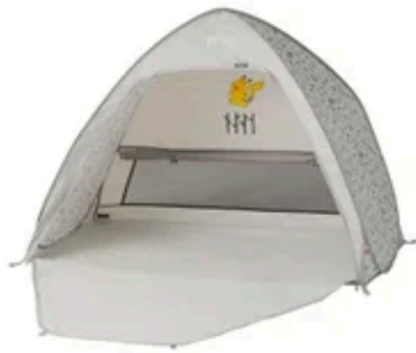
【ポケモン ポップフルシェード】