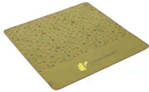
【ポケモン トートイン防水シート・ファミリー】