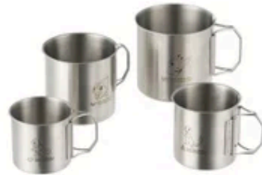
【ポケモン ネストステンマグ4】