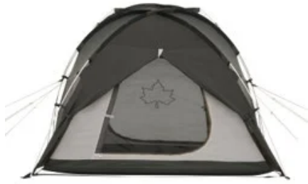
前室にある大型のメッシュ窓