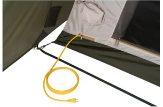
(左上)C型ドア (左下)回転式ジッパー (右上)エアコン用ダクト差し込み口 (右下)電源コード取り込み口

インナーテントには、空気の循環を促すC型ドアや手を持ちかえることなく一気に開閉可能なLOGOS独自開発の「回転式ジッパー」、暑い季節も快適に過ごせる、ポータブルタイプの「エレキャン・エアコン-BF」（別売り）などを設置できるエアコン用ダクト差し込み口、冷気の侵入を防ぐジッパー付きの電源コード取り込み口など、様々な便利機能を搭載。