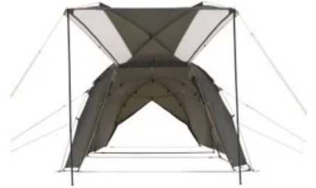
フライシート単独

家族4人がゆったり過ごせる、リビングと寝室が一体化した2ルームテント。前室には大型のメッシュ窓や、フルオープンにできる出入り口を設けることで、通気性の高い開放感ある空間を実現。吊り下げ式で着脱簡単なインナーテントを外すと、フライシート単独で、ファミリーサイズの大型スクリーンタープとしても活躍。