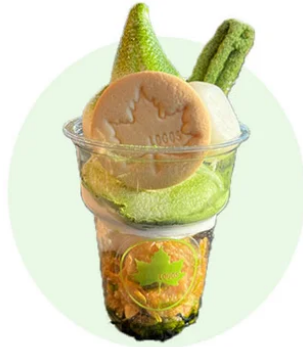
和風チュロスサンデー（白玉入り）