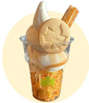
チュロスサンデー

ロゴスカフェでは5月8日から5月25日の期間限定で、メイプルフェスタ特別メニュー発売いたします。