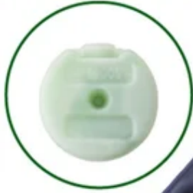
氷点下パック コンパクト (別売)