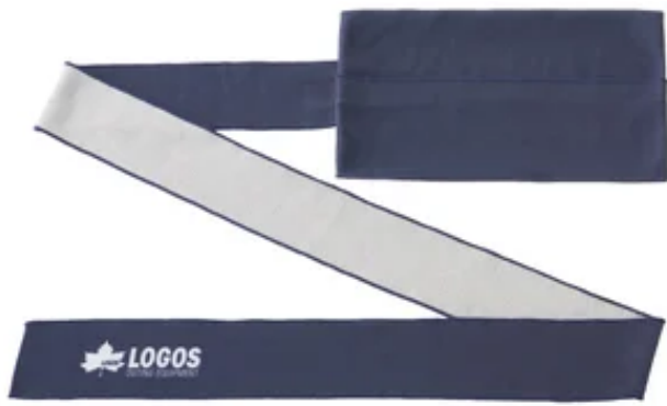
【氷点下リカバリー・クールバンデージ（ロング）】