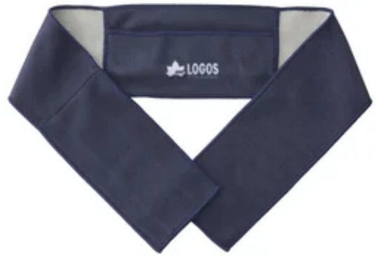
【氷点下リカバリー・クールバンデージ（ショート）】