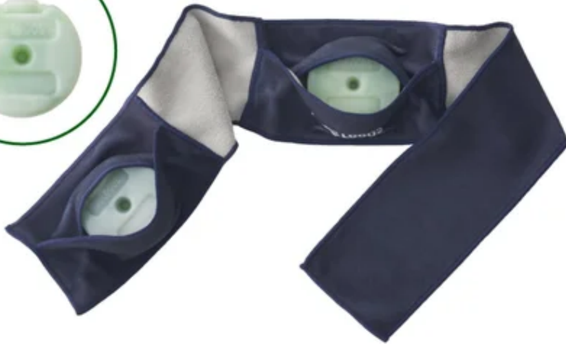
氷点下リカバリー・クールアシスト (別売)