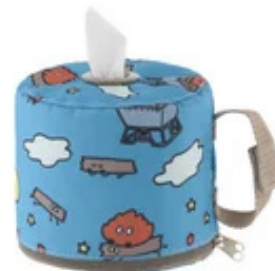
【氷点下パック抗菌・デザインクーラーM】