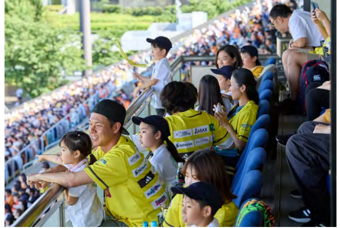
昨年のロゴスマッチデー無料ご招待による観戦の様子

LOGOS FAMILY様限定で、北スタンドでの観戦に無料ご招待。当日はオリジナルステッカーをプレゼント。