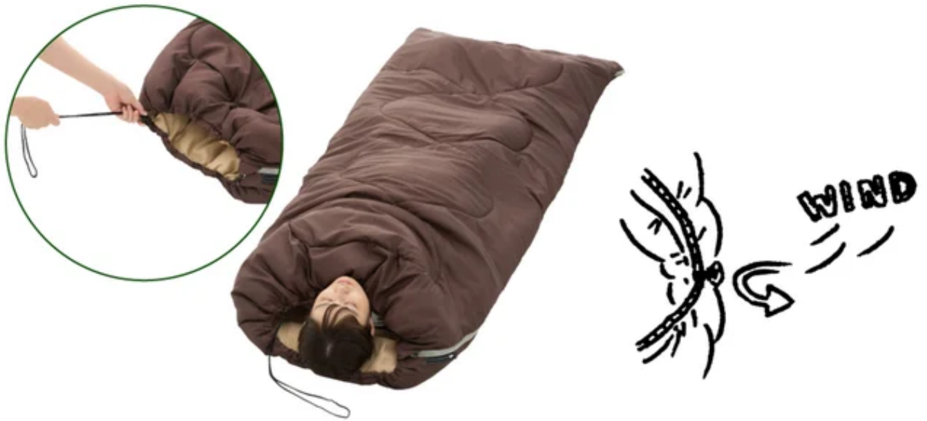
(左) ショルダーガード構造 (右) エアガードシステム

開口部にはショルダーガード構造を採用し、コードを絞れば肩周りの隙間を減らし、冷気の流入を軽減。さらに、寝袋のジッパー部分にドラフトチューブを設けることで、外気流入をしっかり防止し保温性能を高めるエアガードシステム搭載。