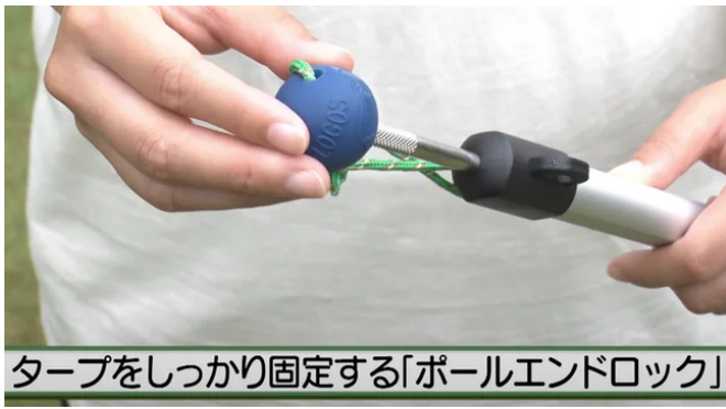
タープをしっかり固定する「ポールエンドロック」