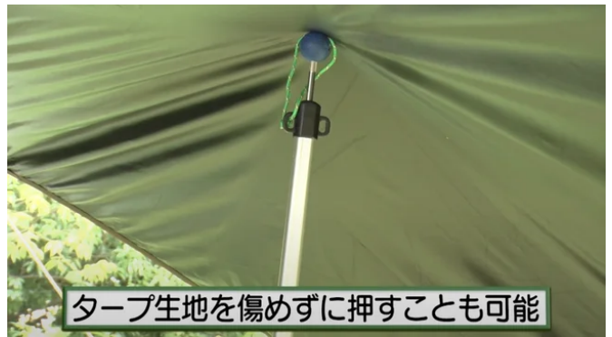
タープ生地を傷めずに押すことも可能

ポール先端に取り外し可能な「ポールエンドロック」がついているため、先端に差し込んだタープ生地をしっかり固定でき、風に飛ばされる心配がありません。