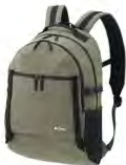
【 LOGOS スタンダード デイバッグL-BE 】

ベルトは自由に長さ調節ができるため、お好みの長さに肩がけや斜めがけが可能。生地には、斜めがけした際に体に馴染む、中綿入りの柔らかいキルティング生地を採用。