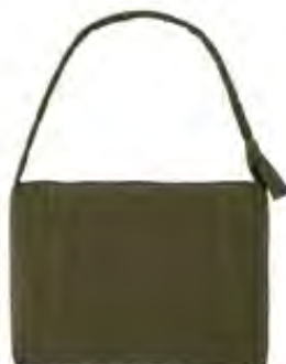
【 LOGOS ニュースーパーキルトバッグ-BE 】