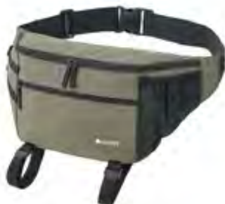
【 LOGOS メッセンジャーラゲージバッグ-BE 】