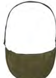
【 LOGOS ムーンキルトバッグ-BE 】