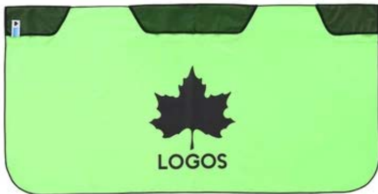
【 氷点下リカバリー・クールボディタオル 】