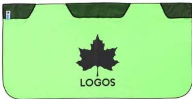
【 氷点下リカバリー・クールボディタオル 】

株式会社ロゴスコーポレーション(本社：大阪市住之江区、代表取締役社長：柴田茂樹)が展開するアウトドアブランドの「LOGOS」は、凍らせることで冷凍タオルとして身体をクールダウンすることができる大型クールボディタオルと、対人冷却にも対応する「氷点下パック®」の新モデルをラインアップした「氷点下リカバリー・クール」シリーズ2種を2024年6月27日(木)より新発売いたします。