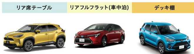
ヤリスクロス カローラツーリング ライズ