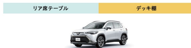
アクティブボックスを 搭載していない カローラクロス