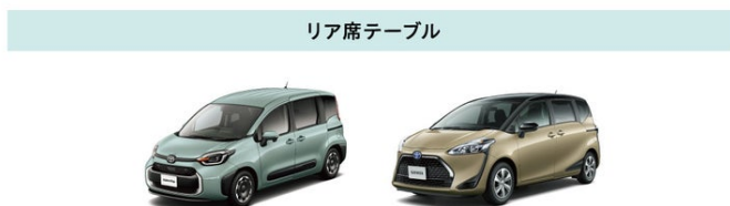
現号シエンタ (3列シート仕様) 旧型シエンタ (3列シート仕様)