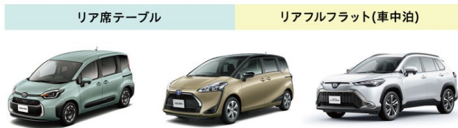
現号シエンタ (2列シート仕様) 旧型シエンタ (2列シート仕様) アクティブBOXを 搭載している カローラクロス