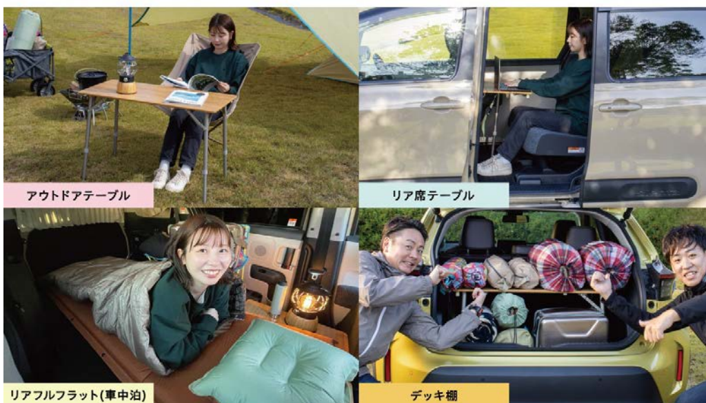
アウトドアテーブル