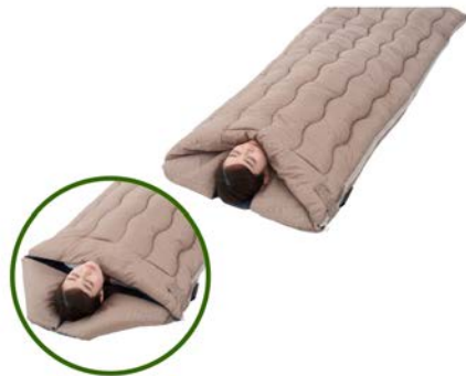
【 抗菌防臭 丸洗いウォーマーシュラフ・-4 】

首周りの冷気を防ぐことができるネックウォーマー構造採用で、寒い環境でも快適。ネックウォーマーは枕としても使用可能。