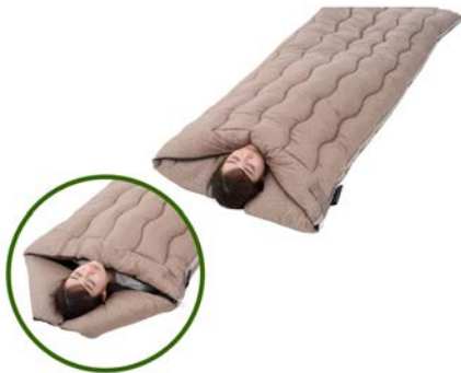
【 抗菌防臭 丸洗いウォーマーシュラフ・-6 】