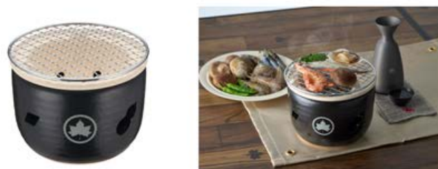
【 LOGOS×萬古焼 卓上水コンロ 】

【 LOGOS×萬古焼 いろいろ吊り鍋 】 https://www.logos.ne.jp/products/info/10297