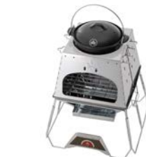
【LOGOS THE KAMADO EMIwa との組み合わせ】

「ピラミッド TAKIBI」や「LOGOS THE KAMADO EMIwa」などの別売りアイテムと組み合わせて、様々なスタイルで楽しめるので、アウトドア調理の幅が広がる。