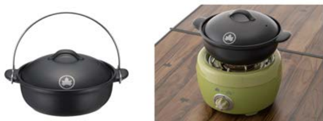
【 LOGOS×萬古焼 いろいろ吊り土鍋 】

株式会社ロゴスコーポレーション(本社：大阪市住之江区、代表取締役社長：柴田茂樹)が展開するアウトドアブランドの「LOGOS」は、日本の伝統産業である「萬古焼」とのコラボレーションにより誕生した、機能性とデザイン性に優れた調理アイテム「LOGOS×萬古焼」シリーズ2種を2022年より発売いたしました。