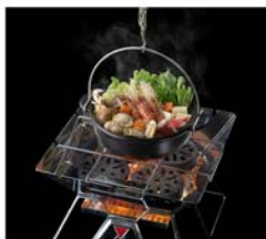
【ピラミッドTAKIBIとの組み合わせ】