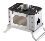
【 ひとり羽釜（別売）をセットした場合 】