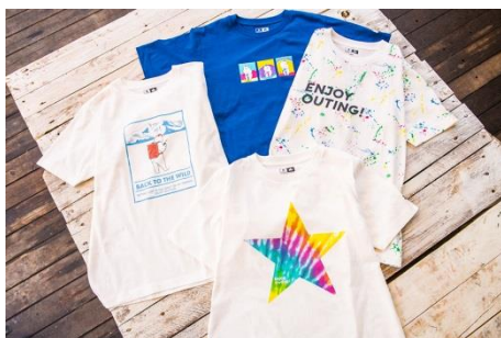
製品名 : プリントT(メンズ) 価格 : ¥2,900(税別) カラー : 全6色