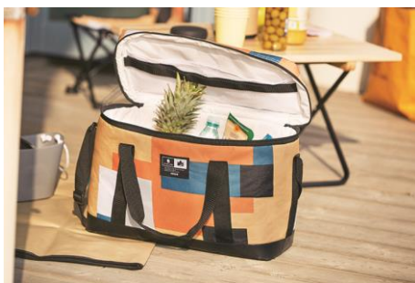
製品名 : クーラーバッグ 価格 : ¥3,900(税別)