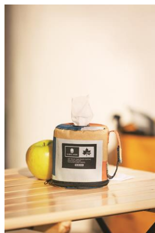
製品名 : ペーパーホルダー 価格 : ¥800(税別)