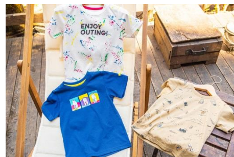
製品名 : プリントT(キッズ) 価格 : ¥1,750(税別) カラー : 全5色