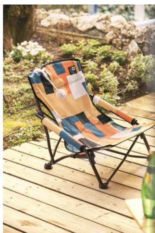
製品名 : アグラチェア 価格 : ¥4,900(税別)