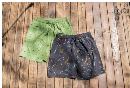
製品名 : ショーツ(メンズ・キッズ) 価格 : ¥4,900・¥2,500(税別) カラー : 各全2色