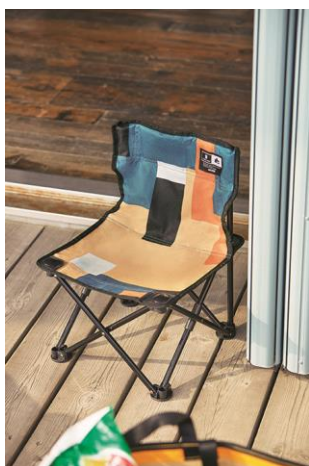
製品名 : タイニーチェア 価格 : ¥2,500(税別)