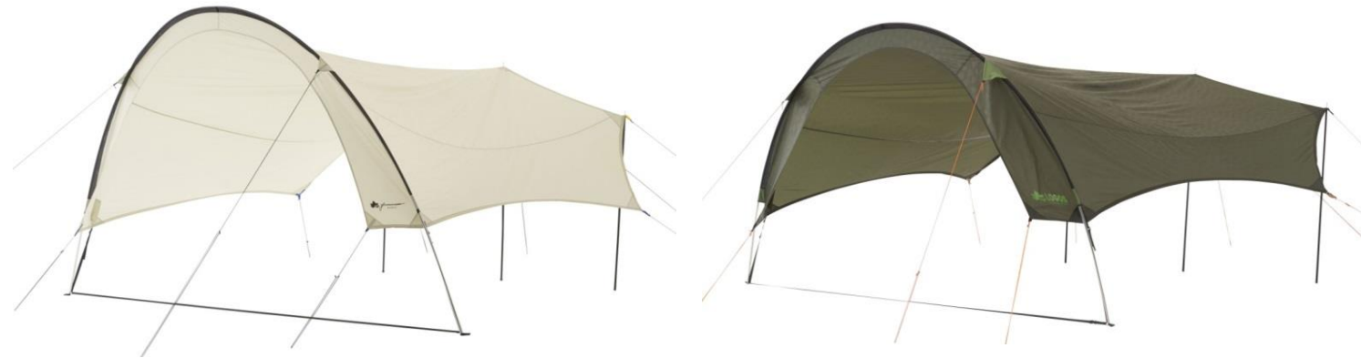
グランベーシック AKUBIタープ-AI