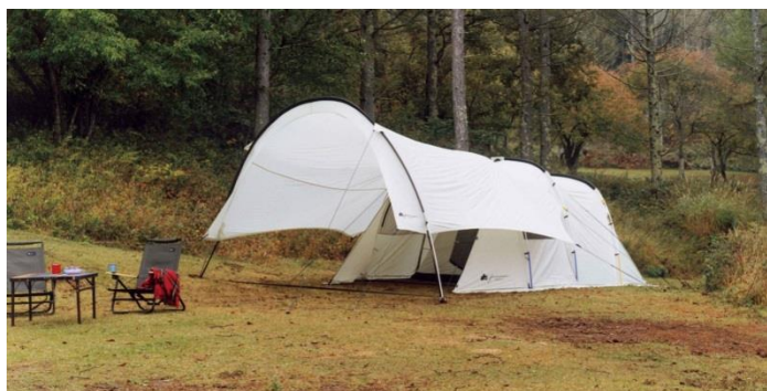
グランベシック AKUBIタープ-AI