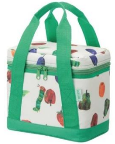
TM & © 2018 Eric Carle LLC.