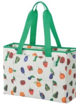
TM & © 2018 Eric Carle LLC.