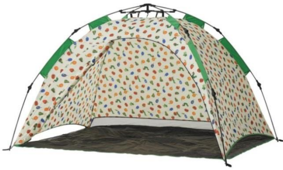
TM & © 2018 Eric Carle LLC.