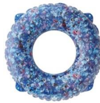
Plantica あぐらチェア Plantica クーラーメッシュリュック Plantica SWIM RING 90