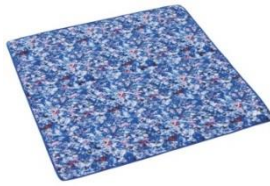
Plantica コンパクトフルシェード Plantica 防水ビーチマット