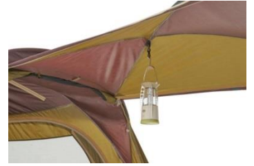
ランタンの設置が可能