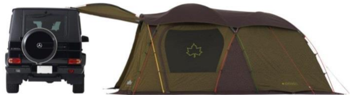
【 キャノピー(車体連結) 】