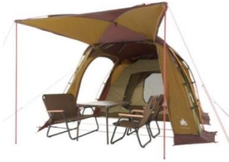
広いリビングスペースの確保