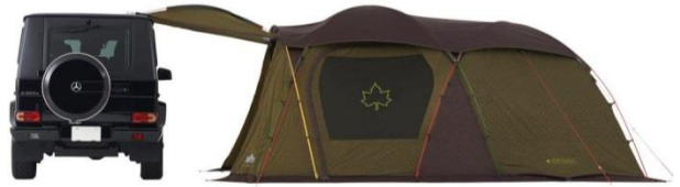
車とのリンクが可能

ロゴス独自の「PANEL SYSTEM」により、テントの前面が付属のキャノピー2本で簡単に自立するタープとなり、広いリビングスペースを確保。また、「筋交い構造」により、強度も向上。