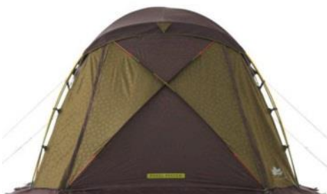
【 フロント 】