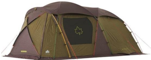
【 クローズ 】