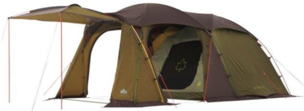
【 キャノピー(オープン) 】