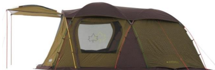
【 サイド 】