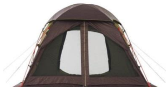
【 バック(メッシュ) 】