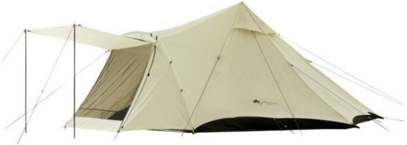
【グランベーシック Tepee 520-AH】

アウトドアブランドのLOGOS（本社：大阪市住之江区、代表取締役社長：柴田茂樹）は、デザイン面の新境地を目指した「LOGOS GLAMBASIC(ロゴス グランベーシック)」シリーズより、大人数で使用できる大型のティピーテント「グランベーシック Tepee」を新発売いたしました。