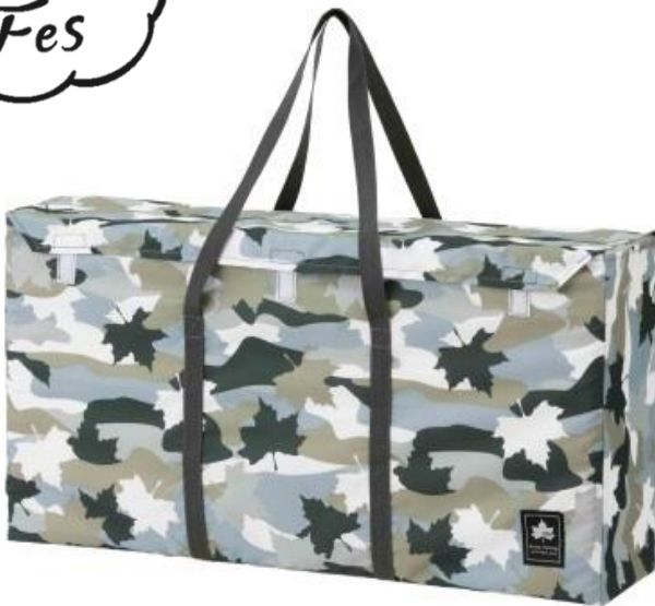
「デザイングリルキャリーバッグL(カモフラ)」