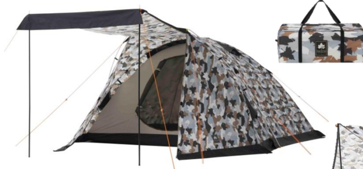
「ベーシックドーム・PLR XL(カモフラ)」