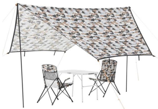
「ツーリングタープ(カモフラ)」