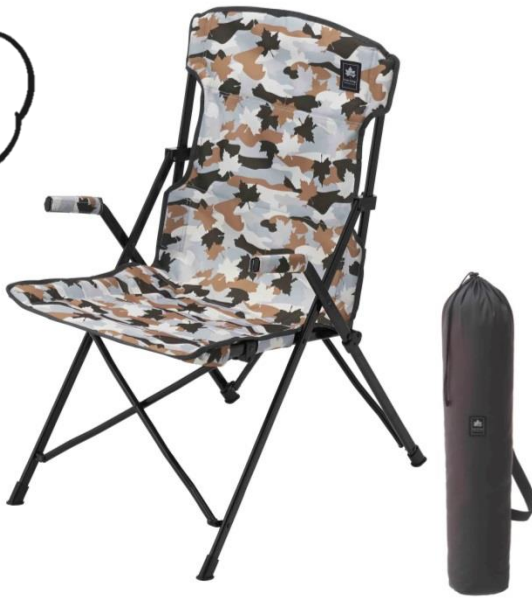
「デザインダイニングチェア(カモフラ)」