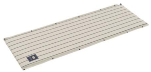
「デザインセルフインフレートマット・SOLO(ピンストライプ)」