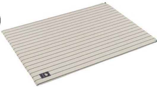
「デザインセルフインフレートマット・DUO(ピンストライプ)」