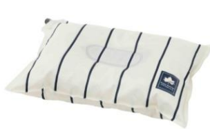
「デザインインフレートまくら(ピンストライプ)」