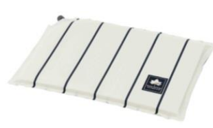
「デザインインフレートざぶとん(ピンストライプ)」