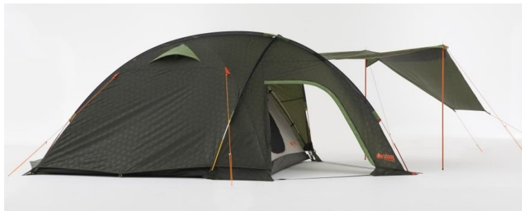
【キャンピー】 フレーム構造の工夫により 2つの大型開口部を備えました。