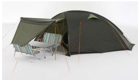
【キャンピー(拡張時)】 キャンピー部分を拡張することで 日よけスペースをさらに確保いたします。