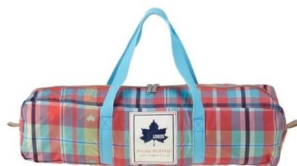
持ち運びに便利な収納バッグ付き