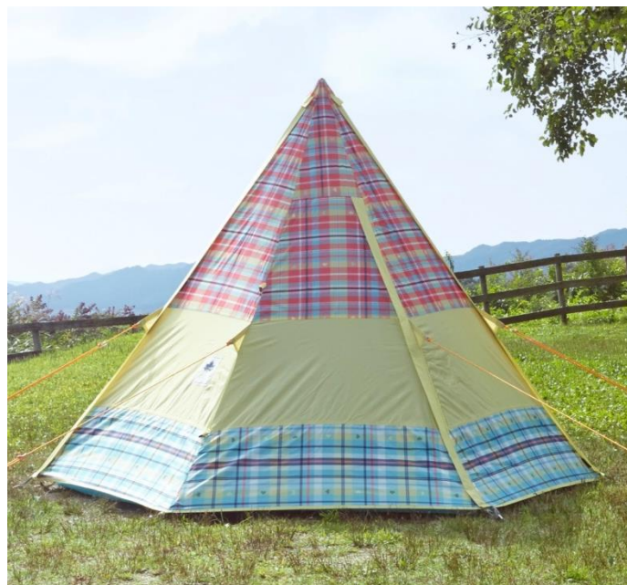
キャノピーポール別売

アウトドアブランドのLOGOS（本社：大阪市住之江区、代表取締役社長：柴田茂樹）は、LOGOS定番のTepeeが進化し、フライシートがキャノピーになる「チェッカーTepee マジックキャノピー 220」を、新発売いたしました。