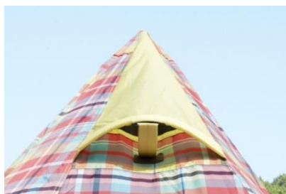
テント内の湿度を逃がし、 快適に過ごせるベンチレーション