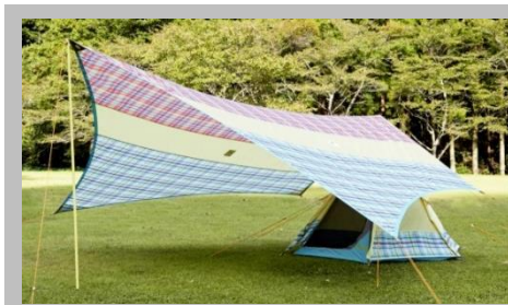
「チェッカーTepee ブリッジヘキサ」 別売のブリッジヘキサと連結可能

「チェッカーTepee マジックキャノピー 220」は、ロゴス直営店（別紙ご参照）をはじめ有名スポーツチェーン店、ホームセンターなど全国で発売しております。