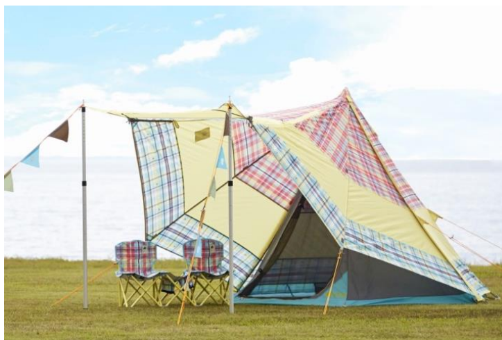
充実したリビングスペースを確保