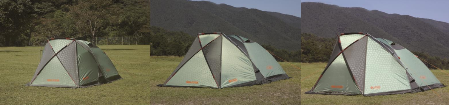
「neos PANELストリームドーム」比較 ※左から「M・L・XL」サイズ