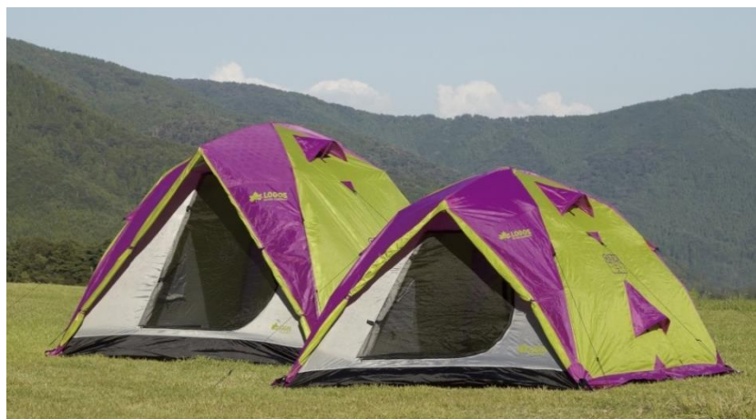
「Q-TOPドーム」比較 ※左から「L・XL」サイズ