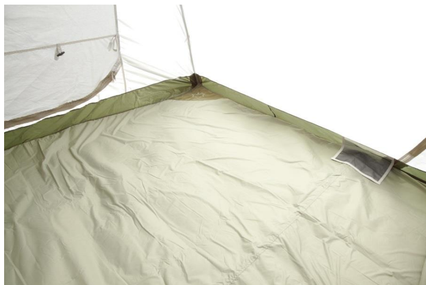
「テントぴったり防水マット」※「M・L・XL・WXL」をご用意