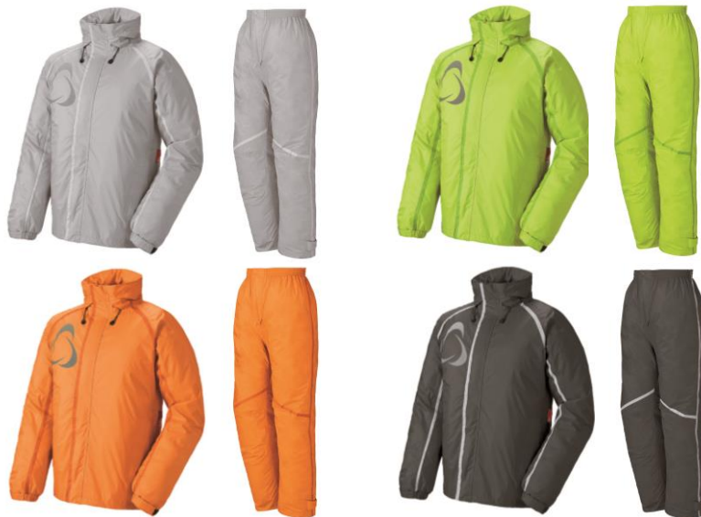
4色の豊富なカラーバリエーション

「蒸れを追放 透湿レインスーツ・フリース」は、ロゴス直営店（別紙ご参照）をはじめ有名スポーツチェーン店、ホームセンターなど全国で発売しております。