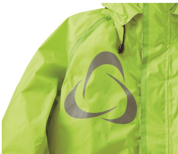
右胸部には、視認性を上げる 再帰反射プリント