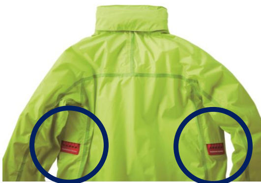
通気性に優れた 『LIPNER Ventilation System』