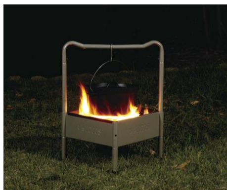
「囲炉裏deダッチグリル」 使用イメージ