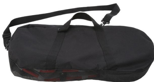
専用キャリーバッグ付き