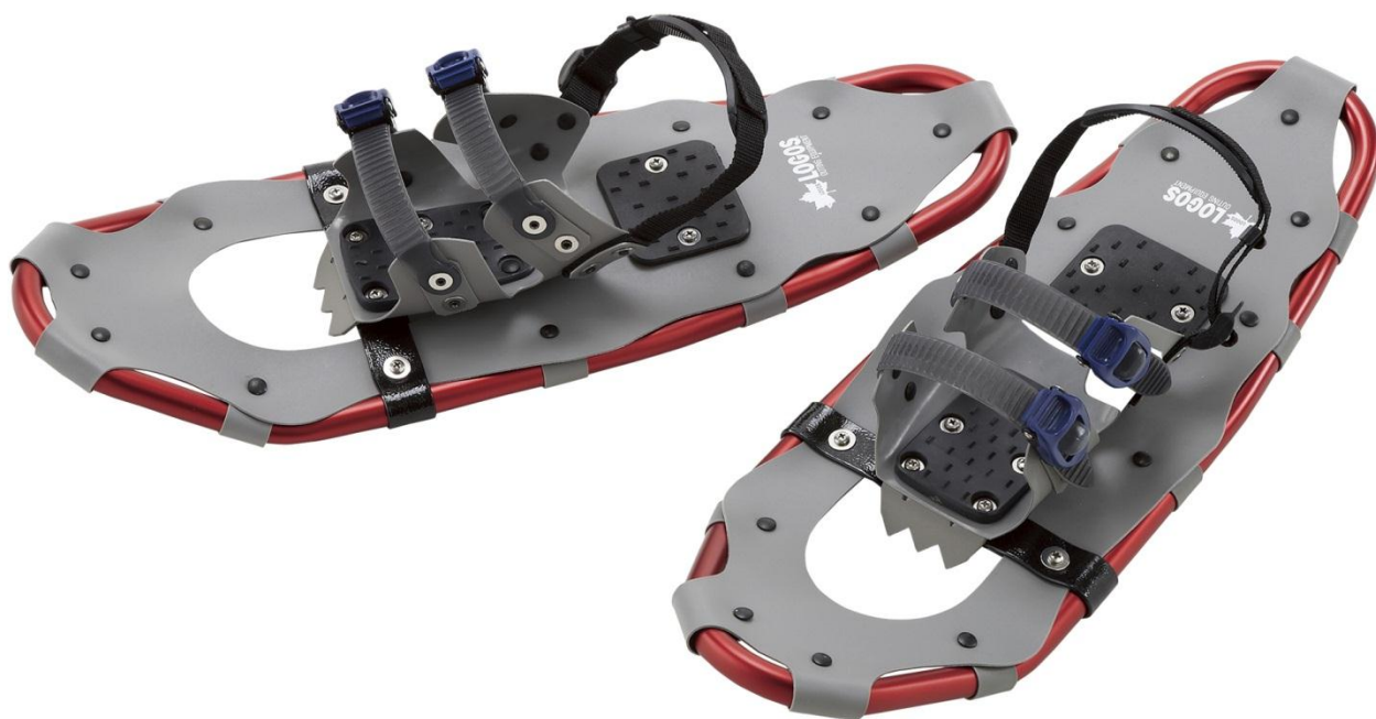
LOGOSスノーシューM OPEN価格

アウトドア用品製造・販売の株式会社ロゴスコーポレーション（本社：大阪市住之江区、代表取締役社長：柴田茂樹）は、「ロゴス」ブランドより“冬もアウトドアを楽しもう！”をテーマに「LOGOSスノーシュー」を12月中旬から新発売いたします。