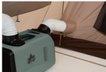
(左上)C型ドア (中央)電気コードジップ (右上)マッドスカート (左下)回転式ジッパー (右下)ポータブルクーラー用差し込み口

空気の循環を促すベンチレーション付きのC型ドア、電源コード取り込み口、雨や冷気の侵入を防ぐマッドスカートの全面装備、LOGOS独自開発の回転式ジッパー、など、快適性を高める機能を多数搭載。インナーテント入口付近にはポータブルクーラー用差し込み口搭載で、別売り「エレキャン・エアコン-BF」を使用すれば、暑い季節でも涼しく快適に過ごせる。