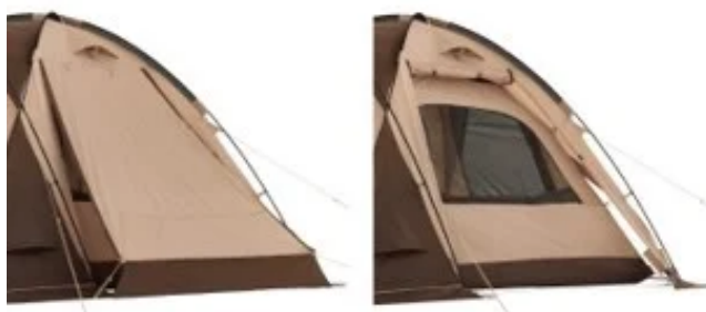
ロールアップ式オーニング

本アイテムは、大型窓とロールアップ式オーニングの採用により、開放感抜群で暑い季節でも家族6人が快適に過ごせる2ルームテント。寝室の側面に設けた2つの大型窓は、風の通り道を確保し、テント内のムレや熱気を軽減。両サイドのロールアップ式オーニングは、外の景色を楽しみながら風を取り込んだり、日差しを遮ったりと、シーンに応じて使い分けられます。