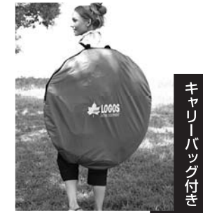
キャリーバッグ付き

当製品は設営の際に勢いよく開きますので、事前に周辺に人や物が無いかを必ずご確認ください。 また、開いた際にフレームが顔や体に当たらないよう十分にご注意下さい。