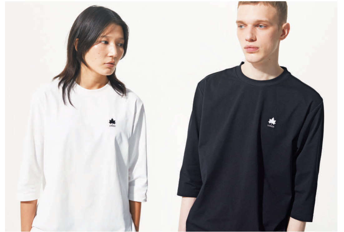
Mother T-SHIRT ¥4,950 Father T-SHIRT ¥4,950