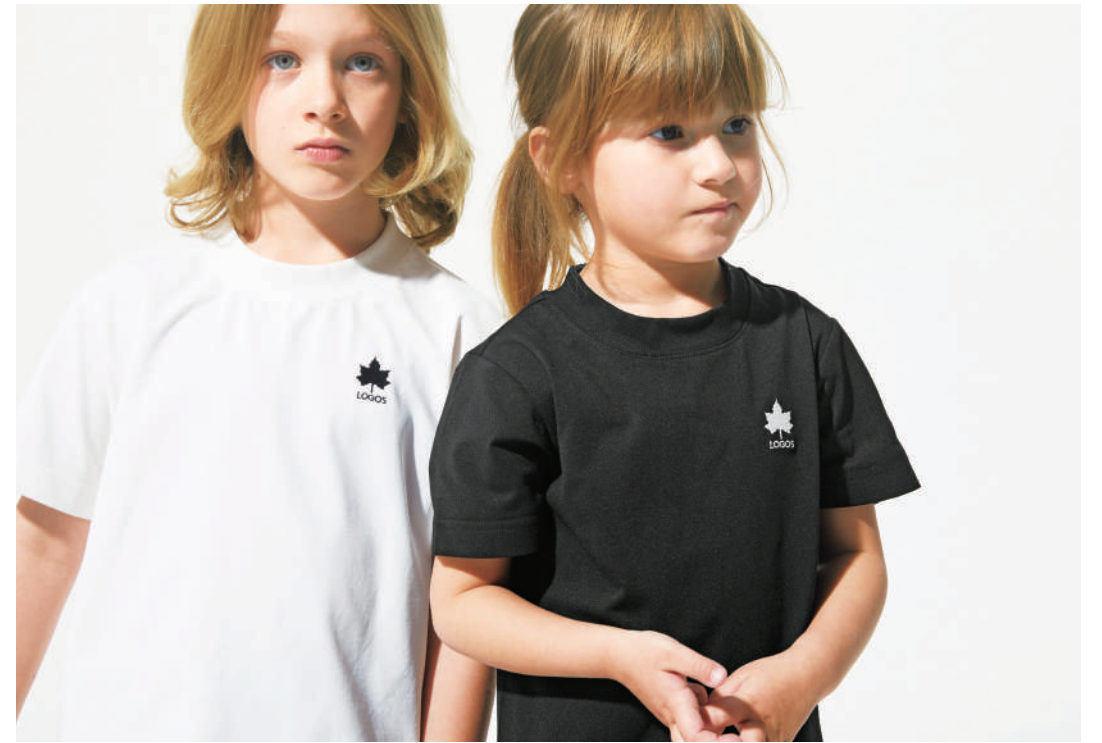
Son T-SHIRT ¥3,960 Daughter T-SHIRT ¥3,960