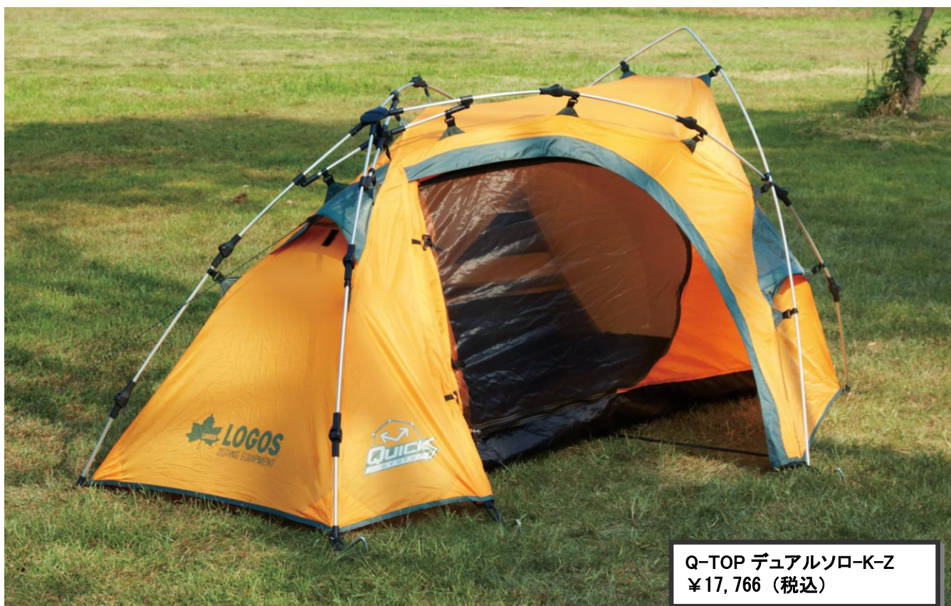
Q-TOP デュアルソロ-K-Z ¥17,766 (税込)

アウトドア用品製造・販売の株式会社ロゴスコーポレーション（本社：大阪市住之江区、代表取締役社長：柴田茂樹）は、組立簡単なQ-TOPシステムを採用した1人用テント「Q-TOP デュアルソロ-K-Z」を新発売いたします。