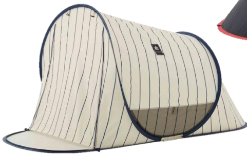
「ポップフルシェルター(230×110cm) (ピンストライプ)」