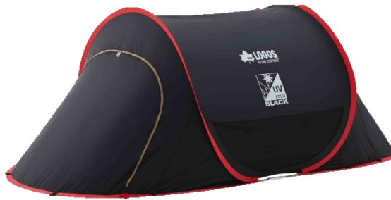
「Black UV ポップフルシェルター-AG」