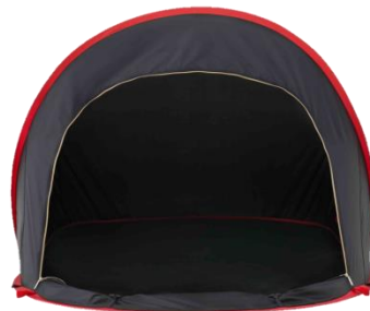
Black UV ポップフルシェルター-AG