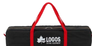
Black UV ヘキサ5750-AG