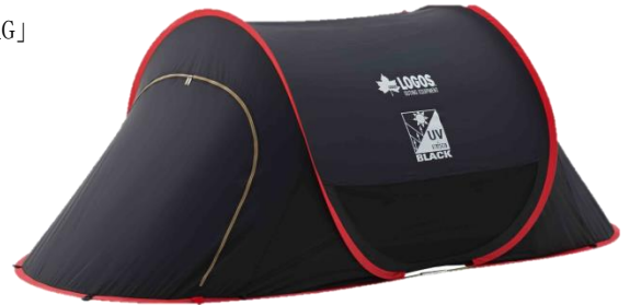
「Black UV ポップフルシェルター-AG」

アウトドアブランドのLOGOS（本社：大阪市住之江区、代表取締役社長：柴田茂樹）は、遮光性が高く日射しに強い「BLACK UV」シリーズを新発売いたしました。