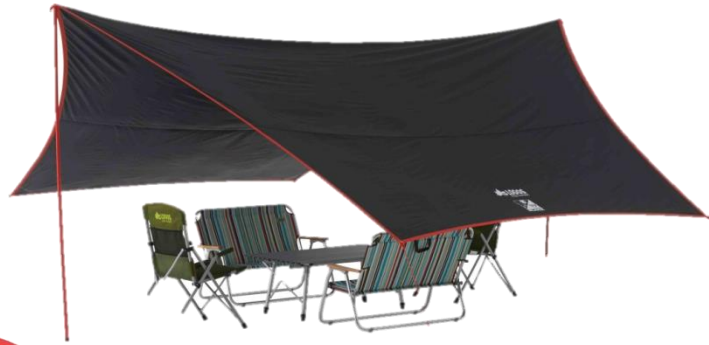
「Black UV ヘキサ5750-AG」