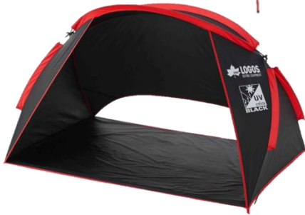
「Black UV パラシェード(180×125cm)-AG」