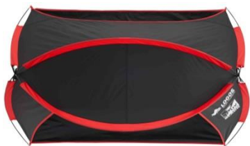
Black UV パラシェード (180×125cm)-AG