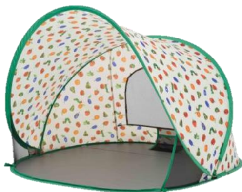
はらぺこあおむし ポップアップシェード