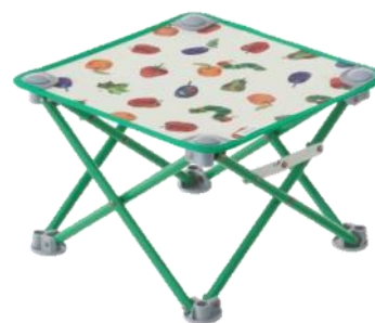
はらぺこあおむし キュービックテーブル

「はらぺこあおむし」シリーズは、ロゴス直営店（別紙ご参照）をはじめ有名スポーツチェーン店など全国で発売しております。