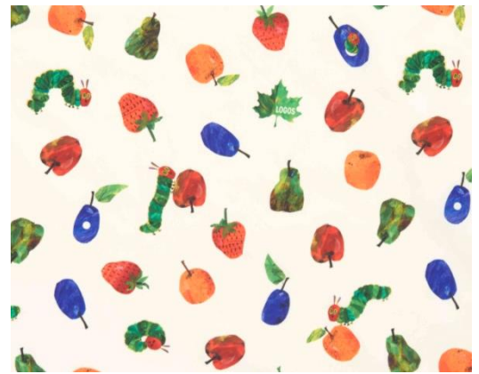
財団公認のLOGOSオリジナルテキスタイル