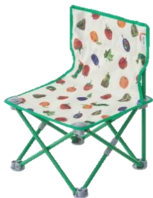
はらぺこあおむし タイニーチェア