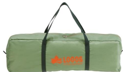
付属のキャリーバッグは、コンパクトに収納でき、持ち運びに便利。