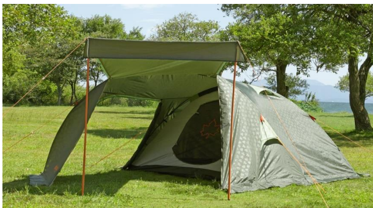
大きな開口部と、開放的なリビングスペースを確保。