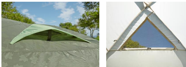
フライシート(上)とインナーテント(下)には、開閉可能なベンチレーション付き。