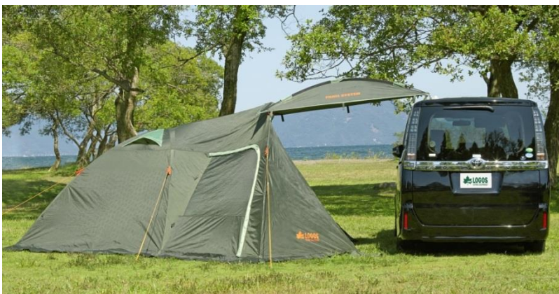
「neos Link Panel PLR」(別売)で、テント同士や車との連結も可能。