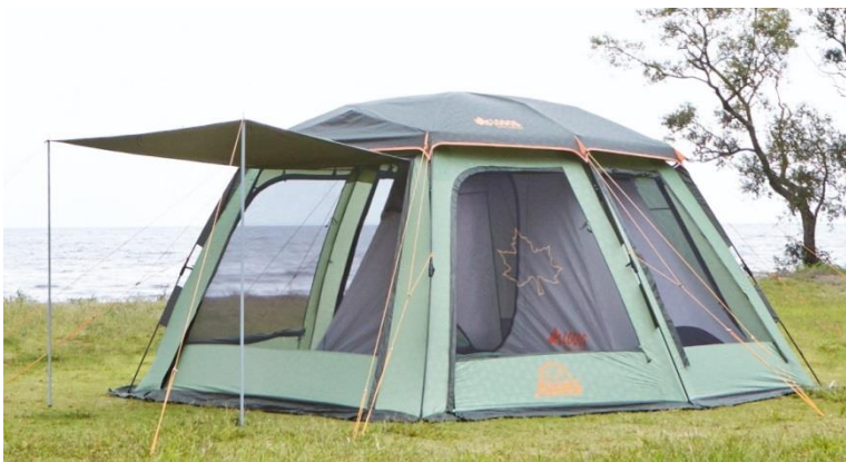
「Q-インセクト2ルーム-AE」