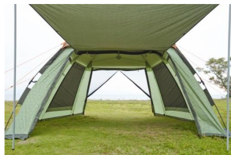
インナーテントを外せば ワイドスクリーンとして使用可能。