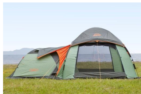
キャノピー対応のドアは、 テントとの連結も簡単。