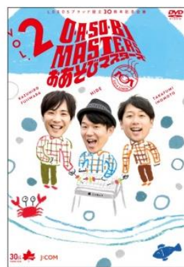
「O・A・SO・BI MASTERS ～おあそびマスターズ～」 (Vol.1もしくは、Vol.2のどちらか) ¥2,500(税別)