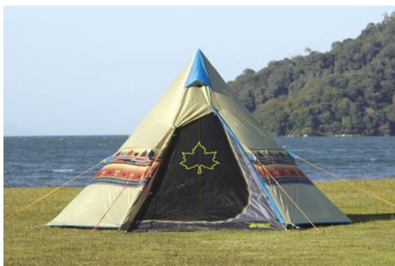
「LOGOS ナバホTepee 300」 ¥18,800(税別)

各媒体様向けに読者プレゼントとして、人気のテント「LOGOS ナバホTepee 300」もしくは、ロゴス製作のアウトドアDVD「O・A・SO・BI MASTERS ～おあそびマスターズ～」 Vol.1もしくはVol.2を、ご提供いたします。(テント、DVD数ともに限りがございます。)