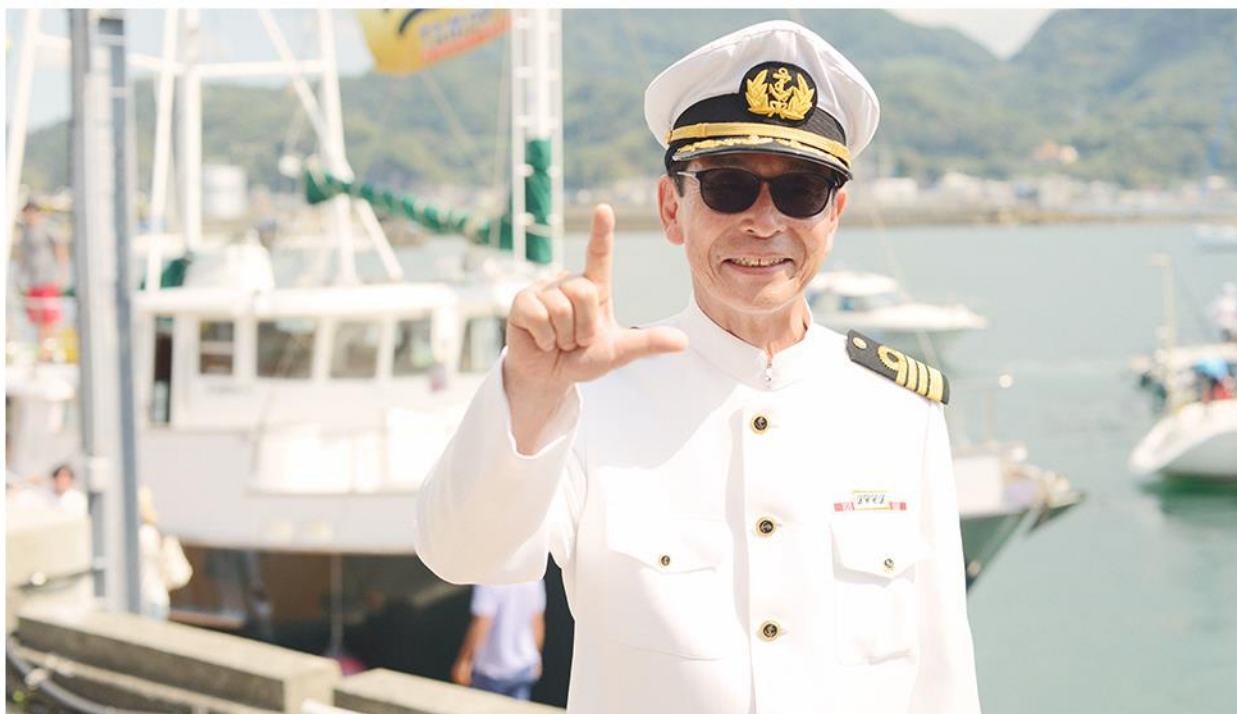
■教えてタモリさん！ BBQソースの作り方。より