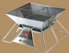
焚火 ピラミッドグリル