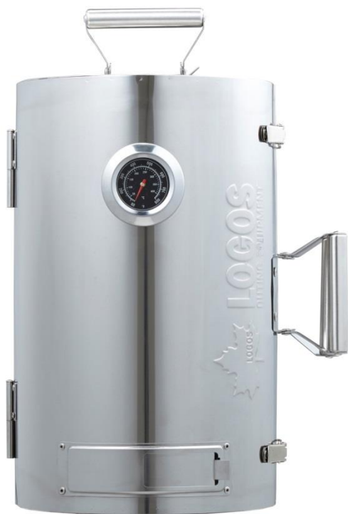
「LOGOSの森林 スモークタワー」