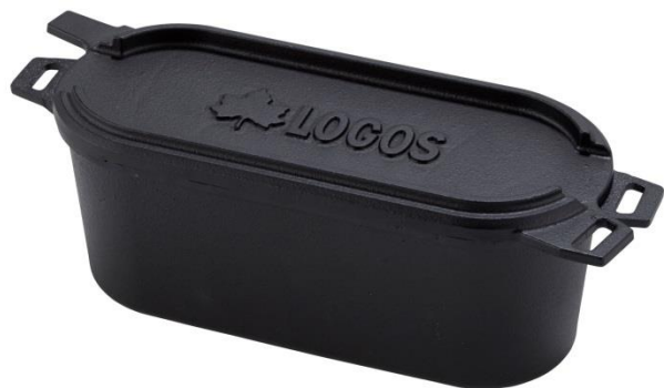
「LOGOSの森林 スモークポット」