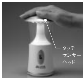
タッチセンサーヘッド