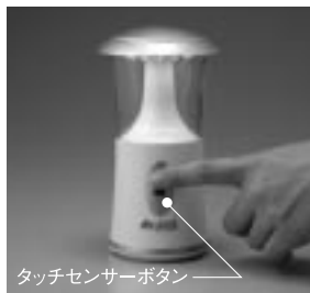
タッチセンサーボタン